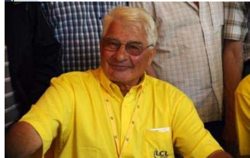
Raymond Poulidor soufflera les trois bougies des Fées du sport demain soir au stadium.